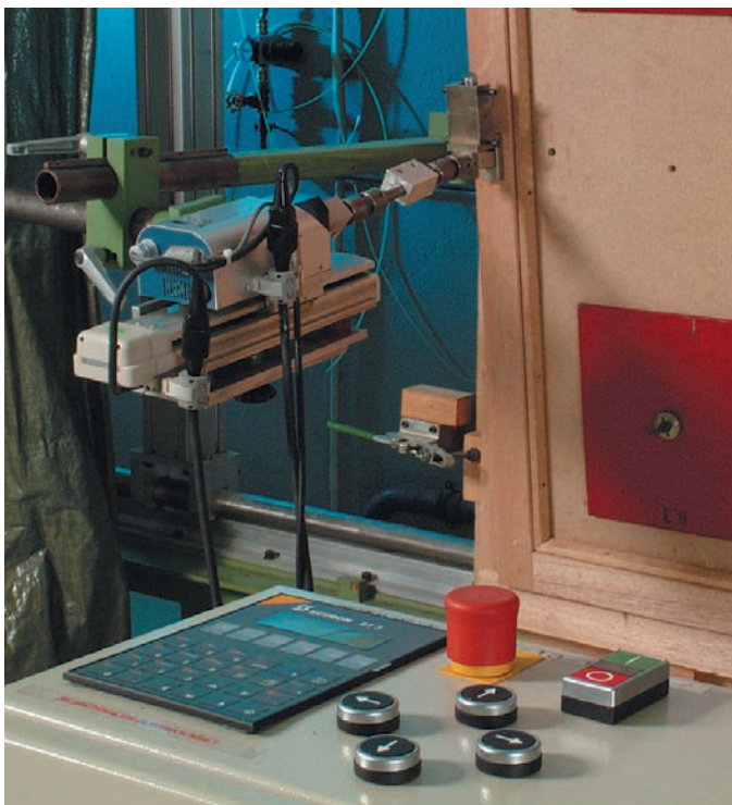
Teilansicht Steuerung Prüfstand Drehkippschläge

Die Prüfung nach beiden Regelwerken besteht grundsätzlich aus einer Dauerfunktionsprüfung, statischen und dynamischen Prüfungen.